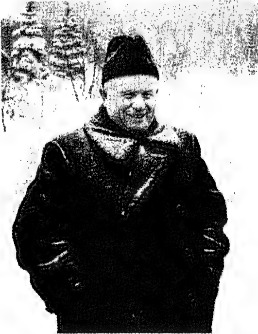
خروتشوف: لقد انتخب سكرتيراً أول للجنة المركزية للحزب الشيوعي السوفييتي بعد وفاة ستالين، وفي المؤتمر العشرين للحزب وجه ضربة قاضية للزعيم الأسطوري...